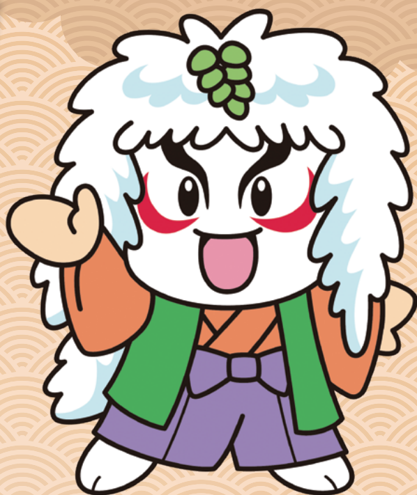
小坂町マスコットキャラクター「かぶきん」