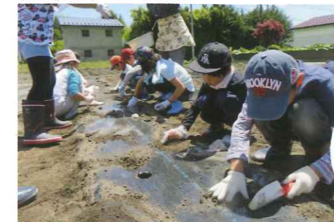
スキップファームでの野菜栽培