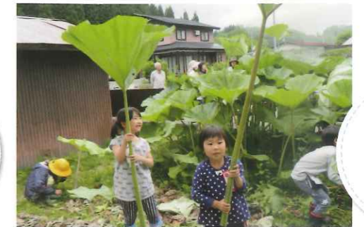
秋田ふき刈りに挑戦