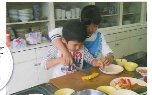
お弁当作ってハイキング～クック&ハイク～