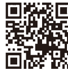
電子保証の仕組み