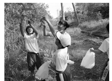
《「アカシア」を採取する給食委員》 《アカシアのかき揚げ》

お問い合わせ先 小坂小学校(TEL29-2422) 小坂中学校(TEL29-3232)