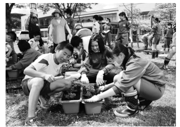
〈植栽している6年生〉

今年度は、新型コロナウイルス感染防止のため小学生と職員のみで実施しました。各学年とも協力し合い、プランターに石を敷き土をならして、ペゴニアを植え込みました。男女仲良く活動している姿を見ていると、微笑ましくなってきました。6年生は、後片付けや掃除など自ら進んで活動していて、さすがは小学校最終学年だなと感心させられました。