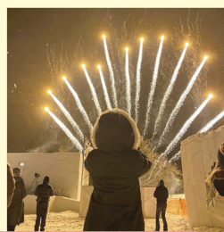
毎日20時～ 冬花火が打ちあがります