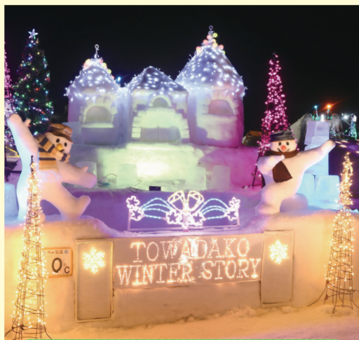
会場入口付近ではモニュメントがお出迎え