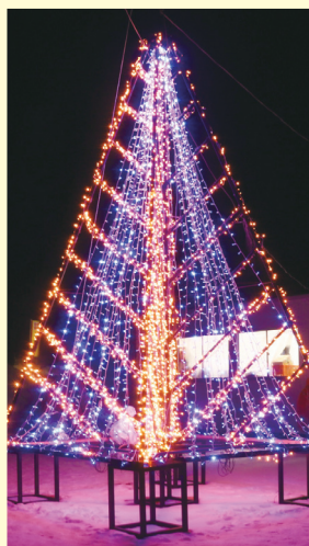
さまざまなイルミネーションを楽しめます