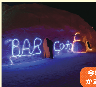
今年のかまくらbarが2つ! かまくら内の雪像も大迫力!