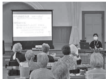
6月は認知症のお話でした！