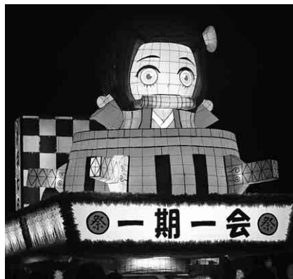
一期一会「〇〇危機一髪」