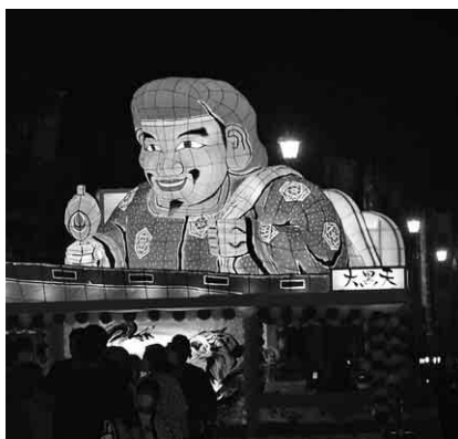
川通り自治会「台福神大黒天」