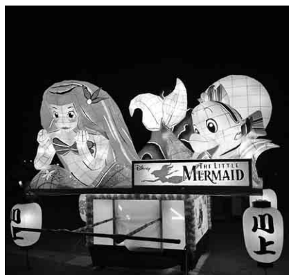
川上連合「リトルマーメイド」