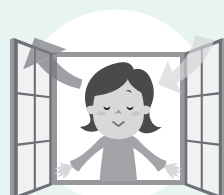
こまめに換気 エアロゾル感染のリスクを軽減