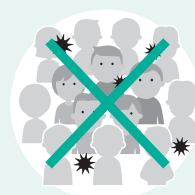
一つの密でも回避