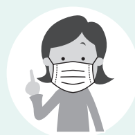
不織布マスクを正しく着用 会食時もマスクが基本