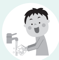
手洗いをしっかり