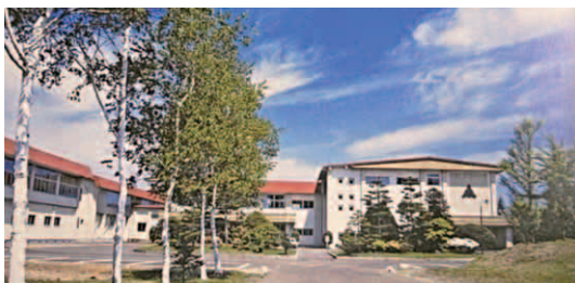
◀現在の小坂高等学校(昭和53年築 館平校舎)

※小坂高等学校のあゆみ大正5年～平成13年は、創立百周年記念誌より引用しています。