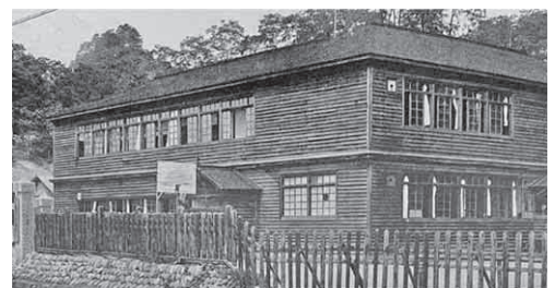
▲小坂町立小坂実科高等女学校 (大正6年築 尾樽部校舎)