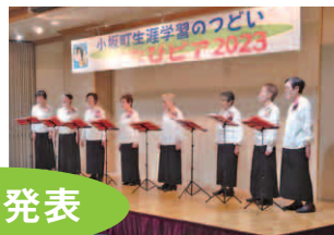
老人クラブ女性部