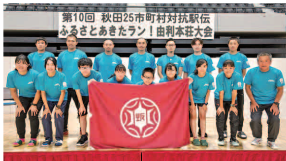
【レース後の晴れやかな表情の町選手団】

今大会は来年以降の開催休止が決まっていますが、これまで出場してくれた選手の皆さんと町民の皆さまの熱いご声援に感謝いたします。ありがとうございました!