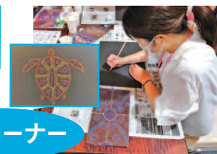
オーストラリア先住民の絵体験