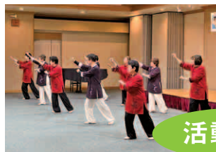
太極拳しらかば・ひばり