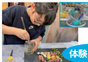
ハーバリウム体験