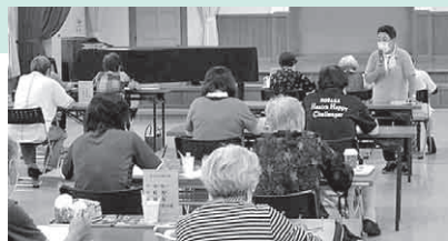
9月は保健師の「国語の教室」でした!