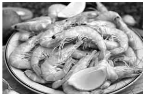
暑い日に新鮮なエビはとても爽やか！

パースのクリスマスデーに気温が40度以上になることはおかしくありません。サンタさんがオーストラリアに来るときも、アメリカみたいにミルクとクッキーをサンタさんに用意しますが、ミルクの代わりに、暑さ対策とし