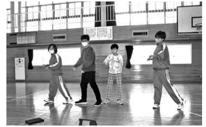
▲ダンス「ONE」を教える中1