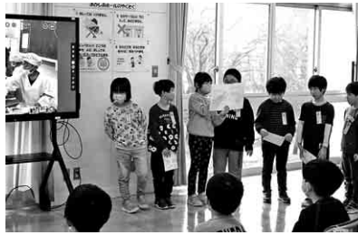
▲学校の1日を紹介する小1

1年生が小学校6年生に応援歌を教えた後、中学校棟を案内したりダンス「ONE」を教えたりしました。4月からの新しい学校生活に向けて期待感を高め、スムーズなスタートができそうです。