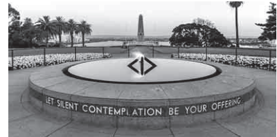
戦没者慰霊碑やいろんな観光ができる大きな植物園キングスパーク