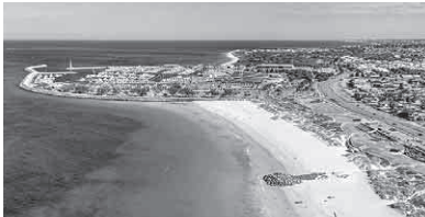
水族館などが近くにあるソレントビーチ

小坂町国際交流協会(KIS)事業として、今月の21日から29日まで小坂・鹿角・大館地域の中高生6人を連れて西オーストラリア州のパース市へ行くことになっています。パースにいる間に、生徒たちはホームステイをして色々な活動をしてきます。その活動の主な行き先をここで簡単に紹介したいと思います。