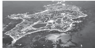
「世界一幸せな動物」と呼ばれているクオッカはここしかないロットネスト・アイランド