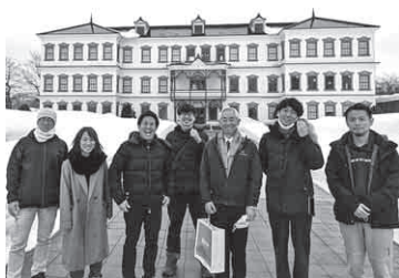
▲渋谷スクランブルスクエア・ハチふる御一行様と記念写真

こうして生まれたご縁を大切に、今後さらなるご縁と交流人口の拡大に努めていきます。