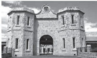
2010年に世界遺産指定されたフリーマントル刑務所