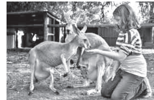
オーストラリア固有動物と触れ合うことができるワイルドライフパーク

海外体験旅行の様子は、KISのインスタグラムでも紹介する予定で、5月には報告会を予定しています。