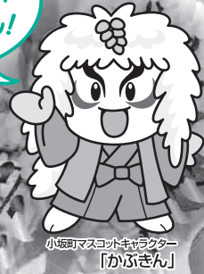
小坂町マスコットキャラクター 「かぶきん」