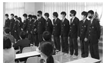
〈両校の交流を深めました〉