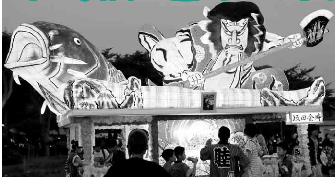
「一昨年の山車をご紹介します」

小坂七夕祭を次のとおり開催します。 今年規模を縮小して展示のみ行い、4台の山車と子どもたち力作の行灯 あんどん が会場を華やかに彩ります。