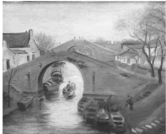
◀小林喜代吉「蘇州橋」一九三九年頃